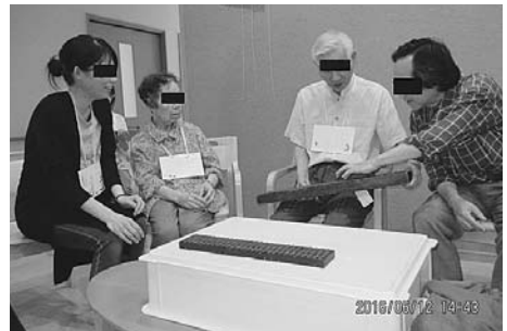
図2、「回想法」風景。「桿秤」を取り囲み、役割りごとに着座(上)。資料の「算盤」を手取る(下)。