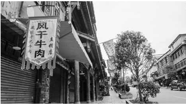
(写真7) ヤク干し肉を売っている看板

(写真6)に関連して、各地で欠かさず売り出される特産品には、ヤク（牦牛）肉関連の製品である（写真7）。