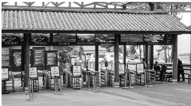
(写真1) 泸沽湖の入口

現代化にあたって、生活の改善から脱貧困へ目標達成をするうえ、少数民族自身が様々な問題に直面せねばならないのである。次章は、現代化とともに伝統文化への保存と展開について、より複雑な社会、経済に関わる困難な背景要因と問題を取りあげる。