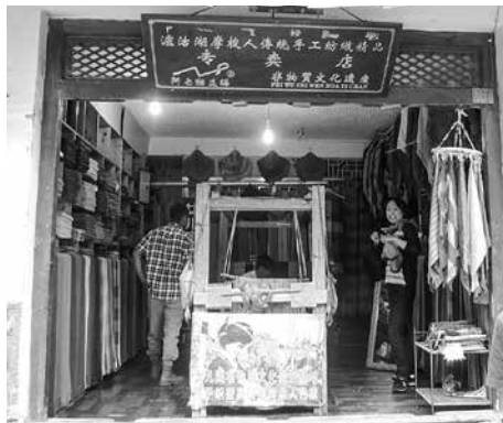
(写真3) 麗江市モソ族手織品専売店

楊氏は、品質管理が統一できるよう、合作社の経営方式に変え、多くの現地婦女個人織り者に参加するよう努力している。商品の文化保存価値を確立させるため、2008年モソ人の母系大家族