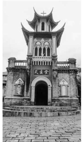
（写真5）摩西鎮にある中西風のカトリック教会

阿坝州は四川省西北部に位置し、甘孜州と隣接している。戦国時代秦国によって（BC316）建制され、長い歴史中、数度改名されたが、1987年「阿坝チベット族羌族自治州」と更名され、四川省第二大チベット族居住地区と主な羌族集住地域である。地理的には、チベット高原東南側にあり、地形は高原と高山峡谷が多く、海拔の高度と気候の変化は甘孜地区と同様である。両自治州現代化産業資源の特徴は、共に旅行業、水資源、自然生態と鉱業が優勢である。中には世界自然遺産資源として、有名な「九寨溝」、「黄龍」のほか、パンダの故郷と保護地区など世界級の観光名所が多くある。甘孜州では、「亜丁自然保護区」、海拔2850 m「海螺溝」にある中国最高（1080m）大（最大幅1100m）の氷滝川など、自然生態の観光名所が多く存在する。歴史人文資源において、「康定情歌」で膾炙人口の「康定」は、古來茶馬古道中心地として風情ある名所である。また瀘定県において、清朝康熙時代（1662年～1722年）川蔵地区経済文化交流のために作った瀘定吊橋のほかに、県内にある摩西古鎮にフランス伝教師が1922年建てた中西風格のカトリック教会（写真5）の遺跡があり、この地区の多元的歴史文化価値を示唆し高めたのである。