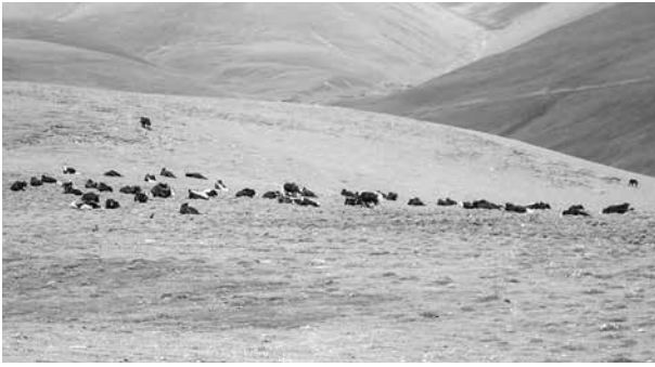
(写真6) 広大な草地に黒いヤク群が随所に見られる