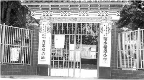
(写真8) ルグ湖イ族の小学校プミ双語教育クラスがある