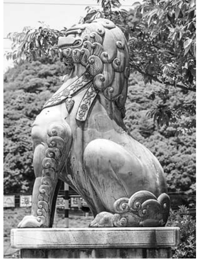
陶山神社狛犬 (佐賀県有田町)