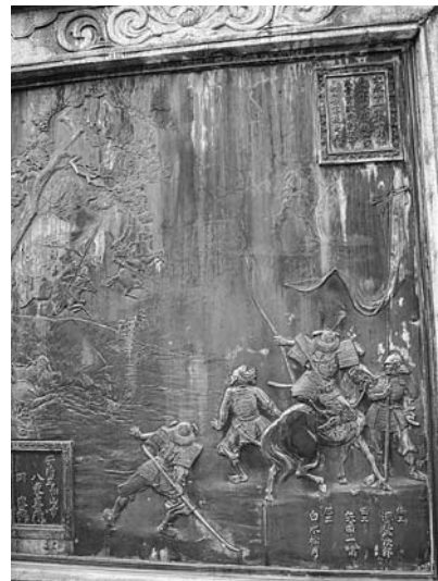
日蓮上人銅像台座レリーフ

明治三十八年（一九〇五）五月二十八日、新築家屋上棟式及び妻の古稀と自分の初老の自祝宴を開催（『福岡日日新聞』明治三十八年五月二十七日）。