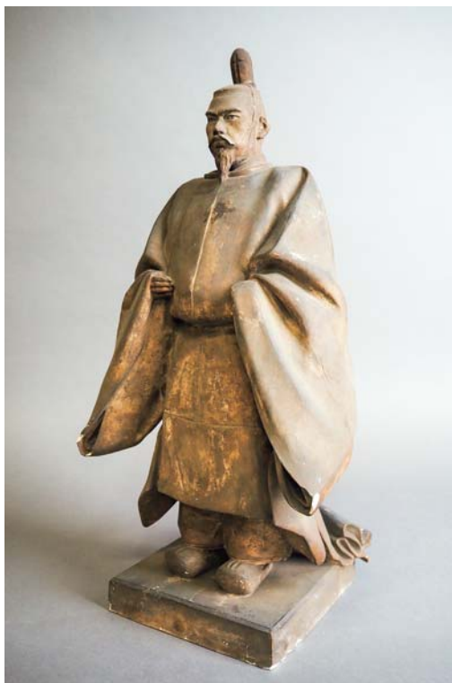
明治天皇御尊像石膏原型（福岡市美術館蔵）