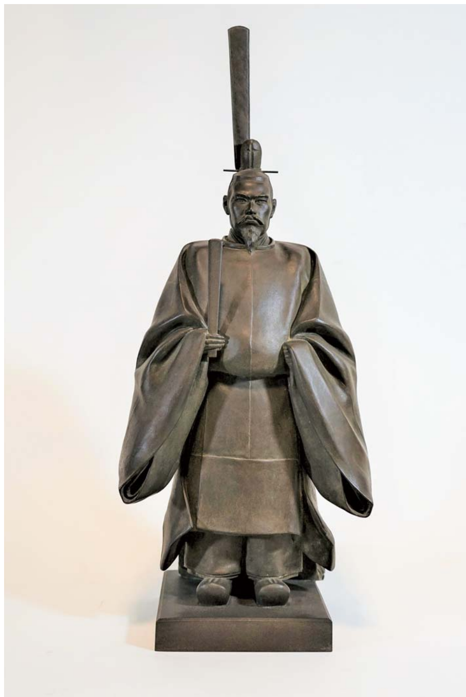
明治天皇御尊像 1921年 山崎朝雲作