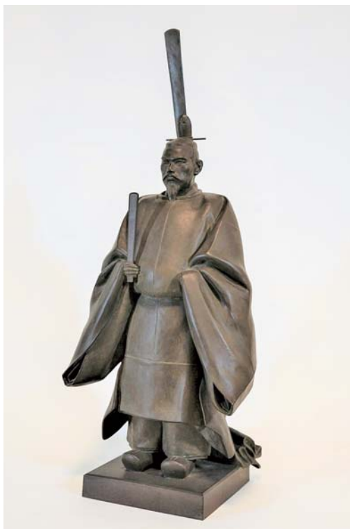
明治天皇御尊像（斜正面）