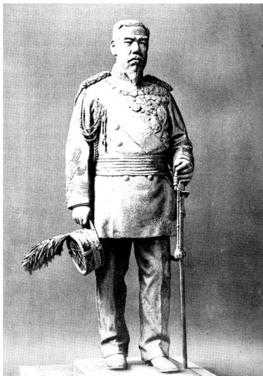
明治天皇御尊像 1914年 渡辺長男作 （『銅像写真集 偉人の俤』より）