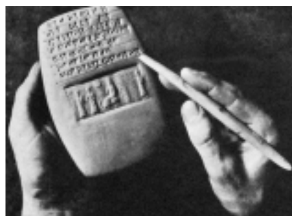
図1．粘土板への楔形文字筆法と円筒印章印影（復元）(Chiera 1938)