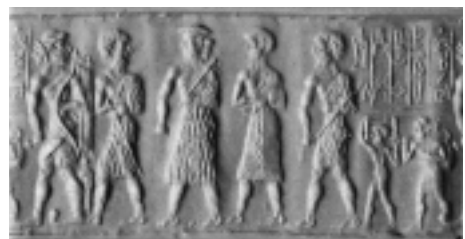
図5．レヤード将来の円筒印章(アッカド期)の新印影(Collon 1990)