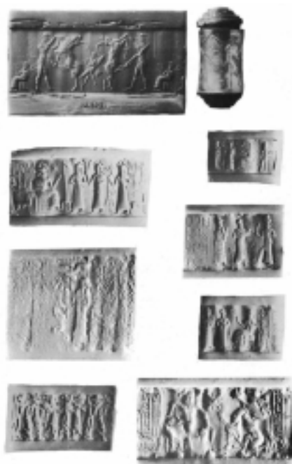
図2．アッカド/バビロニア期円筒印章の新印影 (Basmachi, 1975/1976)