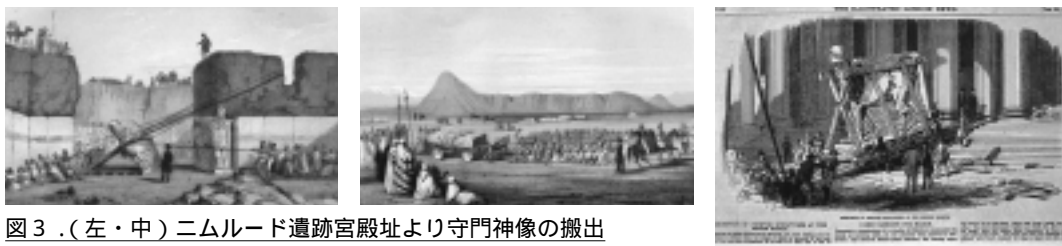
図3 . (左・中) ニムルド遺跡宮殿址より守門神像の搬出 (Layard 1849) (右) 大英博物館への搬入(1852年2月28日付 The Illustrated London News)

円筒印章もまた、他の多種多様な考古資料同様、その真価が明確になるまでの前史があり、資料に対する認識・解釈は時々において異なる。考古資料ましてや「文化財」としての認識は無く、「珍品」「玩物」また時には「戦利品」であった時代が長いであろう。そして帝国主義成立期以降、西アジア地域が古代史・考古学の研究対象地となり、西洋文明の故地として特に生産経済発祥地として再認識されるに至るまでの殆どの期間、西アジアは、事実上、欧米による考古資料の搾取対象地であった。パピロニアに始まった円筒印章は西アジア一帯に広がっていたので、その西アジアから「珍品」「玩物」また時には「戦利品」が流出すれば、そこに円筒印章が含まれていたことは、可能性として十分に考えられ得る。果たして然りである。