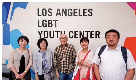
LA LGBT センター（Youth センター エントランス）

施設は9カ所の施設がロサンゼルス市とウエストハリウッド市に点在し、そのいくつかは近接して立地し、ホームレスの若者向けの100台のベッド、シニアコミュニティセンター、若者のドロップインセンターとアカデミー、さまざまなプログラムのためのスペース、2020年に完成したアニタメイローゼンス