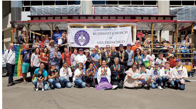
サンフランシスコのプライドパレードに参加したサンフランシスコ仏教会 LGBTQ+メンバー

り、学園としてゆかりが深いのである。仏教では、仏教が伝わっていない地域に教えを弘めることを「開教」といい、その役割を担う僧侶を「開教使」と呼ぶ。本願寺教団は他の宗派に先駆けて海外開教を行ってきており、サンフランシスコ・ロサンゼルスなどの米国西海岸地区は北米開教区と位置づけられ、明治末期より開教が行われてきた 37 。