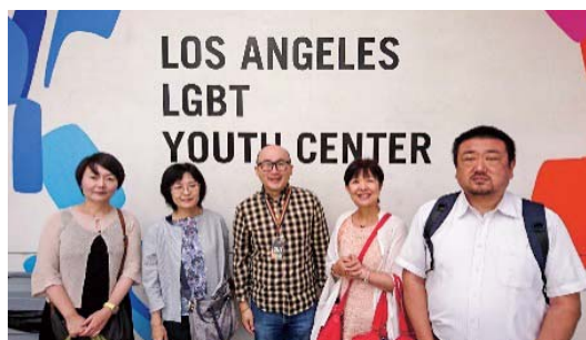
LA LGBT センター（Youth センター エントランス）

施設は9カ所の施設がロサンゼルス市とウエストハリウッド市に点在し、そのいくつかは近接して立地し、ホームレスの若者向けの100台のベッド、シニアコミュニティセンター、若者のドロップインセンターとアカデミー、さまざまなプログラムのためのスペース、2020年に完成したアニタメイローゼンス