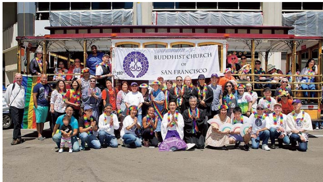
サンフランシスコのプライドパレードに参加したサンフランシスコ仏教会 LGBTQ+メンバー

り、学園としてゆかりが深いのである。仏教では、仏教が伝わっていない地域に教えを弘めることを「開教」といい、その役割を担う僧侶を「開教使」と呼ぶ。本願寺教団は他の宗派に先駆けて海外開教を行ってきており、サンフランシスコ・ロサンゼルスなどの米国西海岸地区は北米開教区と位置づけられ、明治末期より開教が行われてきた 37 。