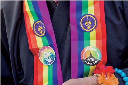
LGBTの象徴であるレインボーカラーの輪袈裟 ワシントンDCのスミソニアン博物館にも展示された (作成：福田泰子)

きる人々とともに活動してきた。マイノリティとしての苦悩や痛み直面する日々の積み重ねによって、さまざまなマイノリティへの共感力が培われ、同性婚の必要性への理解も容易だったのだろう。その結果、他の宗教よりも早い段階から、同性婚の儀礼が執行されてきたと考えられる。社会的弱者の立場に立ち続けるということは、仏教の普遍性を具現化していく実践の重要な在り方の一つであり、大乘菩薩道の実践そのものである。