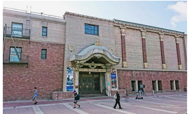
全米日系人博物館（旧西本願寺羅府別院）

全米日系人博物館は、1992年にロサンゼルスのリトルトーキョーで開館した。この建物は日系一世によって1925年に建てられた旧西本願寺羅府別院を修復したものであり、ロサンゼルス市の史跡・文化的建造物に認定されている。1999年には本館の隣に新館パビリオンが開館し、日系移民史、日系社会史、戦時中の強制収容所体験、日系人のアメリカ社会への貢