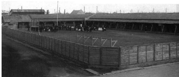
〈1948年3月設立された金剛学校校舎〉

白頭山力強い山脈漢拏山まで 韓民族の血を受け継いだ一つの根の民族(単一民族) 玄海灘の波を越えて異域の沿道 われらの賢明な韓国の学園 その名は高いのだ 金剛の学園 永遠に輝け 金剛の学園