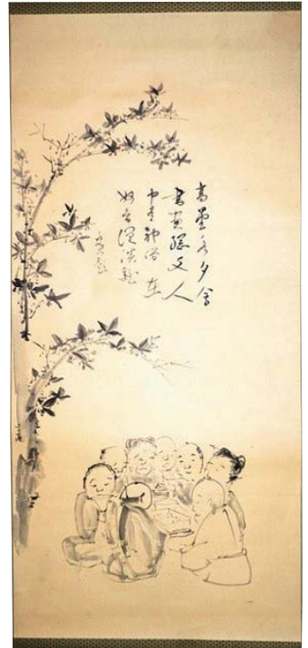
【图7】亀井一家集合図 山口白貴筆