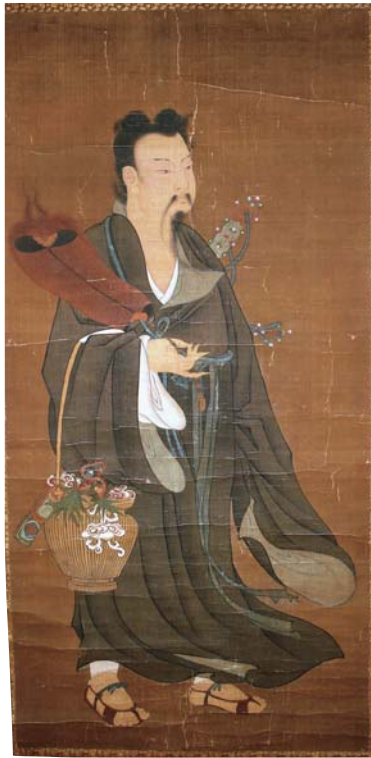
【图8】仙人図 作者不詳