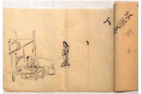
【图10】墨画綴「夢想図」 覚円筆