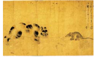
【图3】猫鼠之図（部分） 上田主親筆