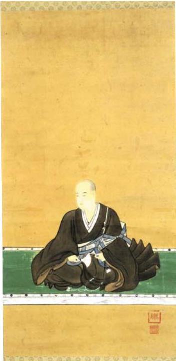
【图4】正演上人像 上田永調筆