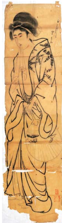
【图9】团扇美人図 覚円筆