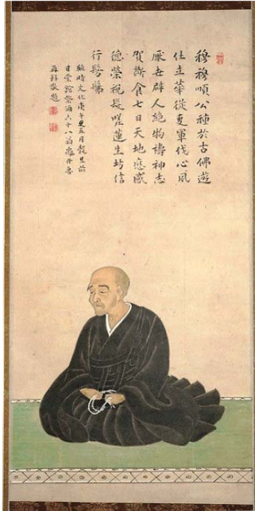
【图6】劔順像（浄満寺開山縁起） 亀井南冥賛