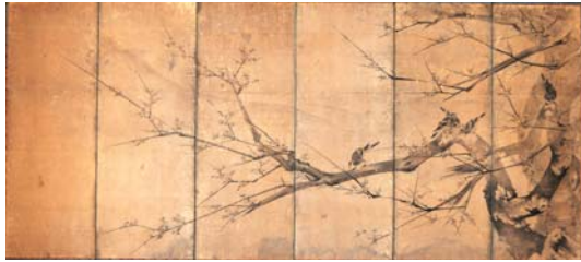
【图2】梅に鳩・東坡風水洞図屏風 狩野宗眼重信筆