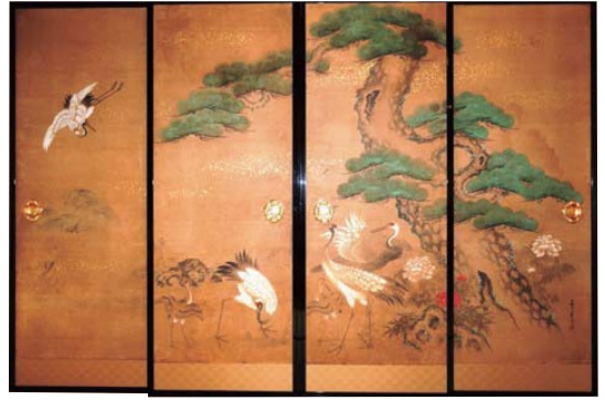
【图5】松鶴図襖絵 衣笠守是筆