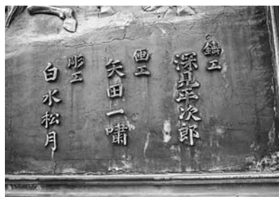
日蓮上人銅像台座レリーフ （上図の右下部分）