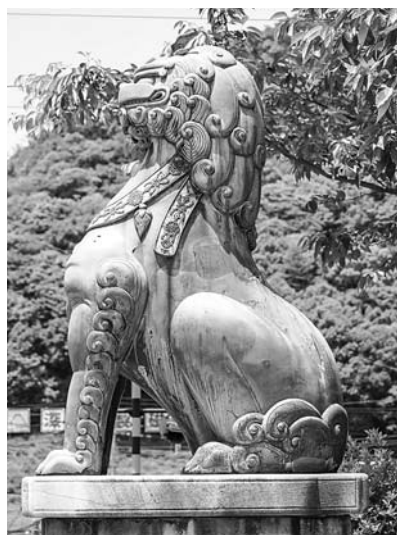
陶山神社狛犬 (佐賀県有田町)