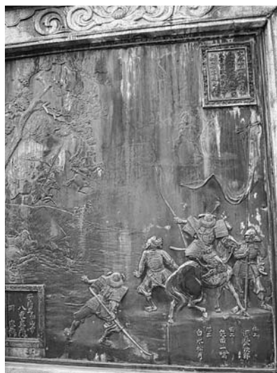
日蓮上人銅像台座レリーフ

明治三十八年（一九〇五）五月二十八日、新築家屋上棟式及び妻の古稀と自分の初老の自祝宴を開催（『福岡日日新聞』明治三十八年五月二十七日）。