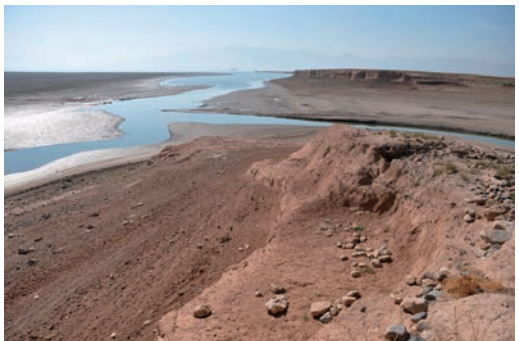
写真6 テル・シムシャラ遺跡からドカン・ダムを望む。遺跡手前はダム湖の浸食により大きく削平を受けている。遠方ダム湖に浮かぶ小島は、テル・バスマシアン遺跡（北から撮影）。