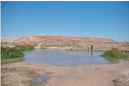
写真3 ヤーシーン・テベ遺跡（南から撮影）。遺跡手前の水溜まりは、近隣のベスタンスール遺跡付近の泉から流れ出た小川によるもの。