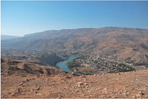
写真1 ドカン市北を流れる小ザーブ川溪谷（北から撮影）。