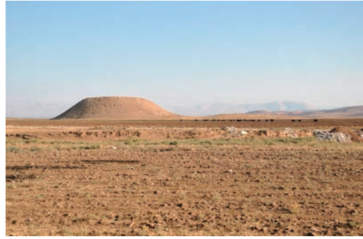
写真2 シャフリゾール平原の景観。ザラーイン西付近。遠景にうっすら見える山岳はハラブジャ東のイランとの国境をなすザグロス山系の支脈。