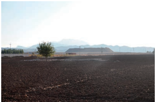
写真4 バクル・アワ遺跡（東から撮影）。円錐台形の形状がはっきりと分かる。