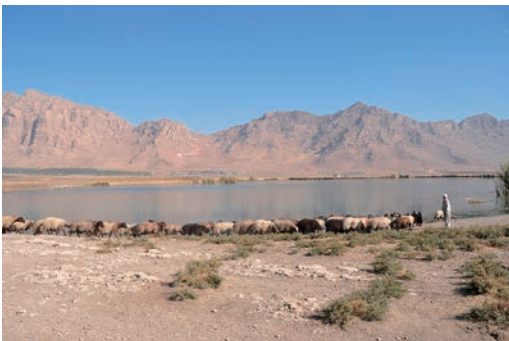
写真5 ラニヤ平原の景観（南から撮影）。