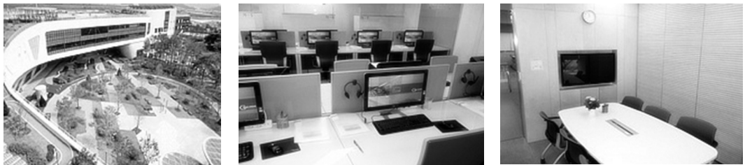
<図1>スマートワーク「セジョンセンター」

資料： http://www.smartwork.go.kr 「スマートワークセンター」